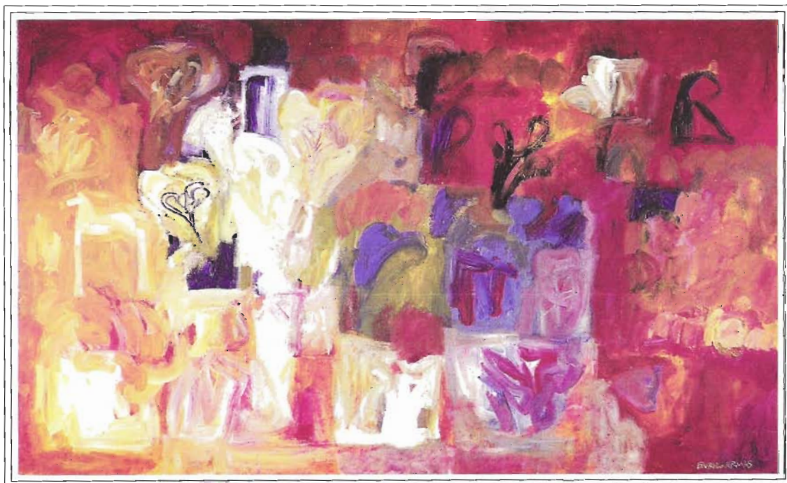
"Colorido Matinal", 120/200 cm, Acrílico sobre tela, año 2000.