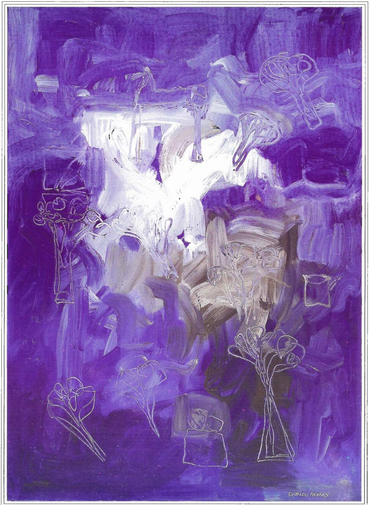
"Flores, Personajes y Caballos", 140/100 cm, Acrílico sobre tela, año 2000.