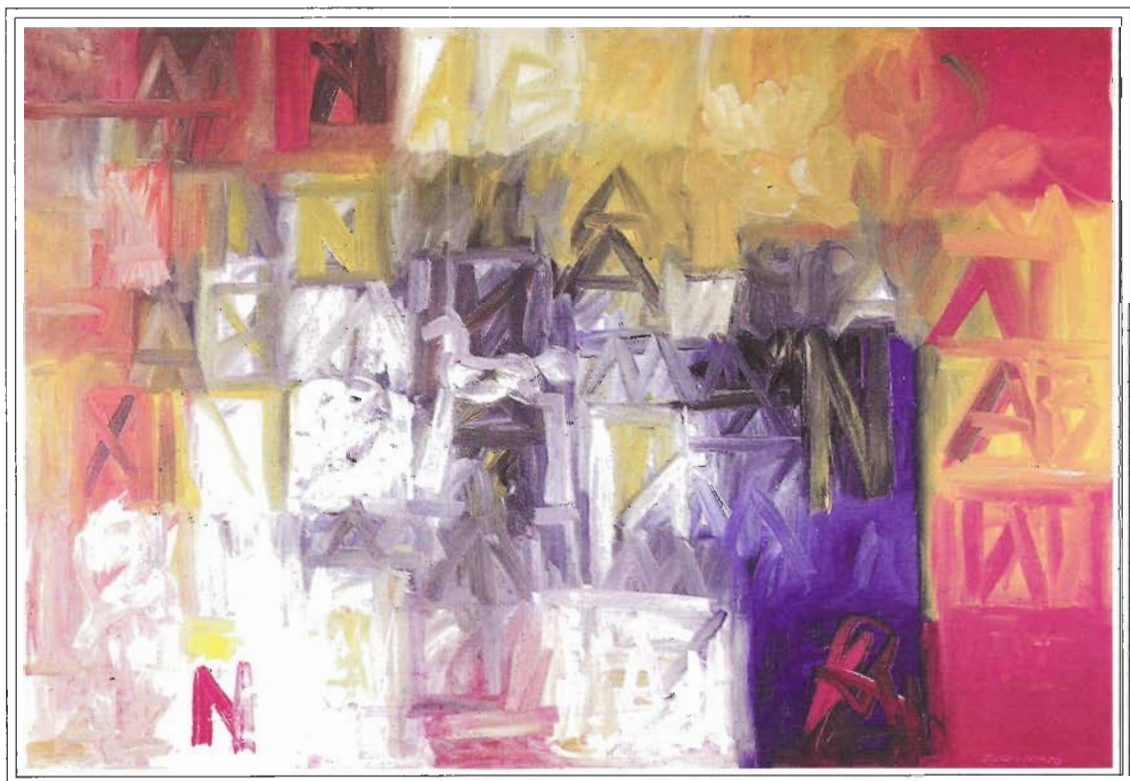
“Lenguaje Intimo”, 130/190cm, Óleo sobre tela, año 2000.