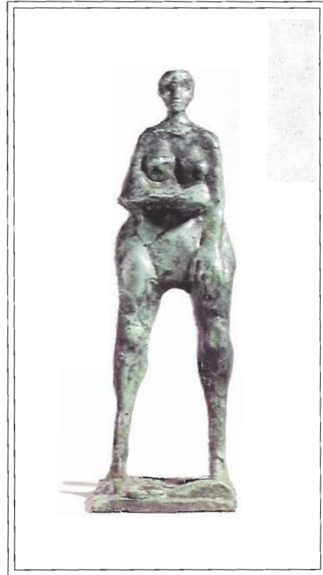
"Resignación", Bronce, P.U, 48/ 16/15 cm, año 2000