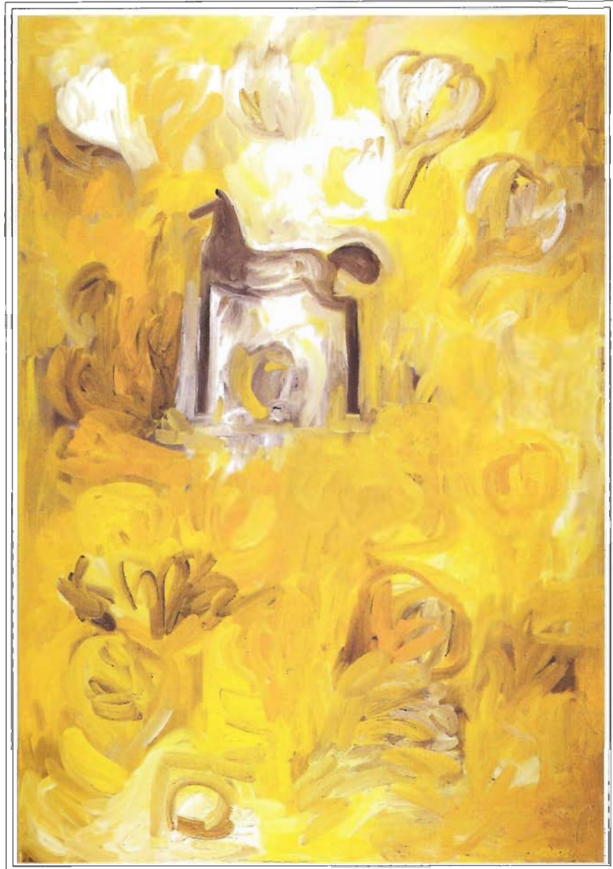
“AMANECER” 190 x 130 cm, Óleo sobre Tela, Año 2000