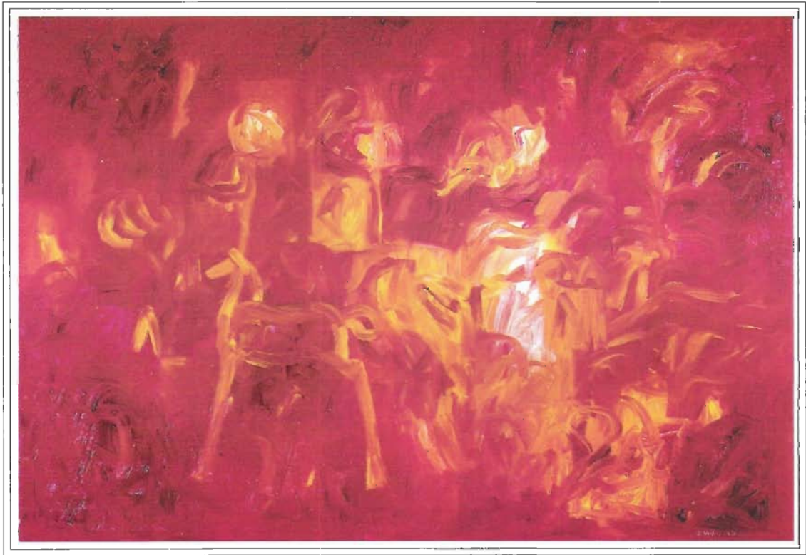
“Fuego del Alma”, 130/190cm, Óleo sobre tela, año 2000