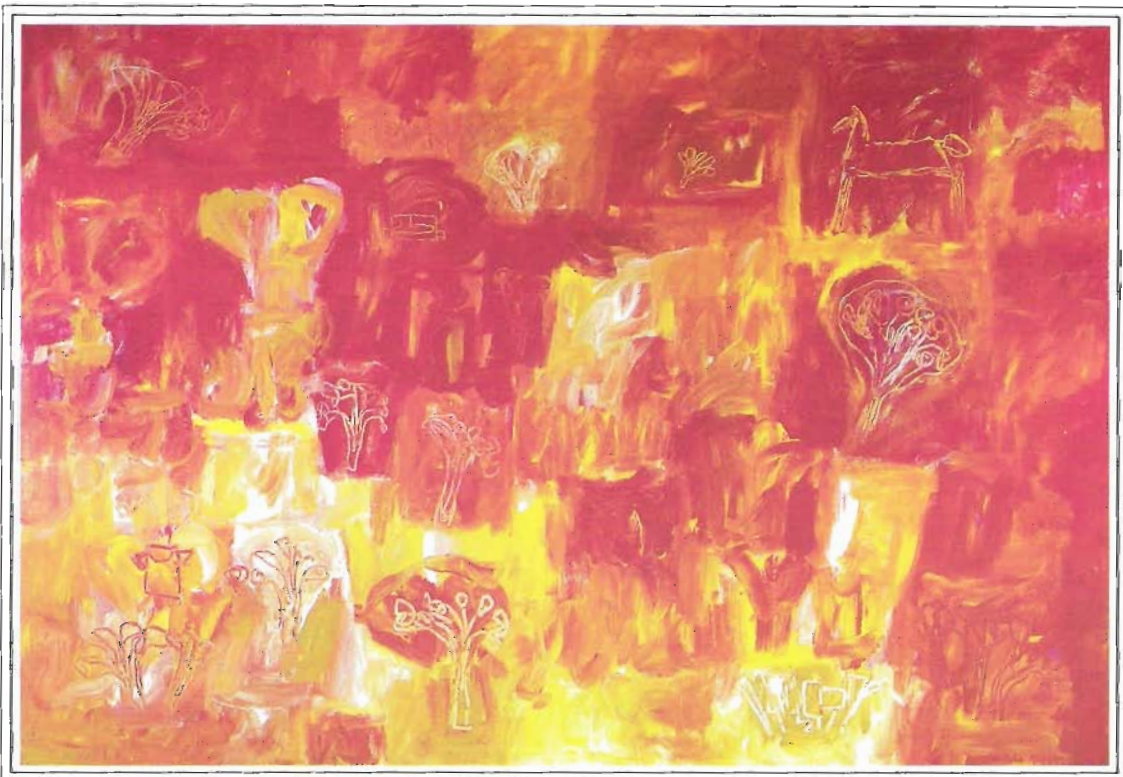
"Atardecer", 130/190 cm, Acrílico sobre tela, año 2000.