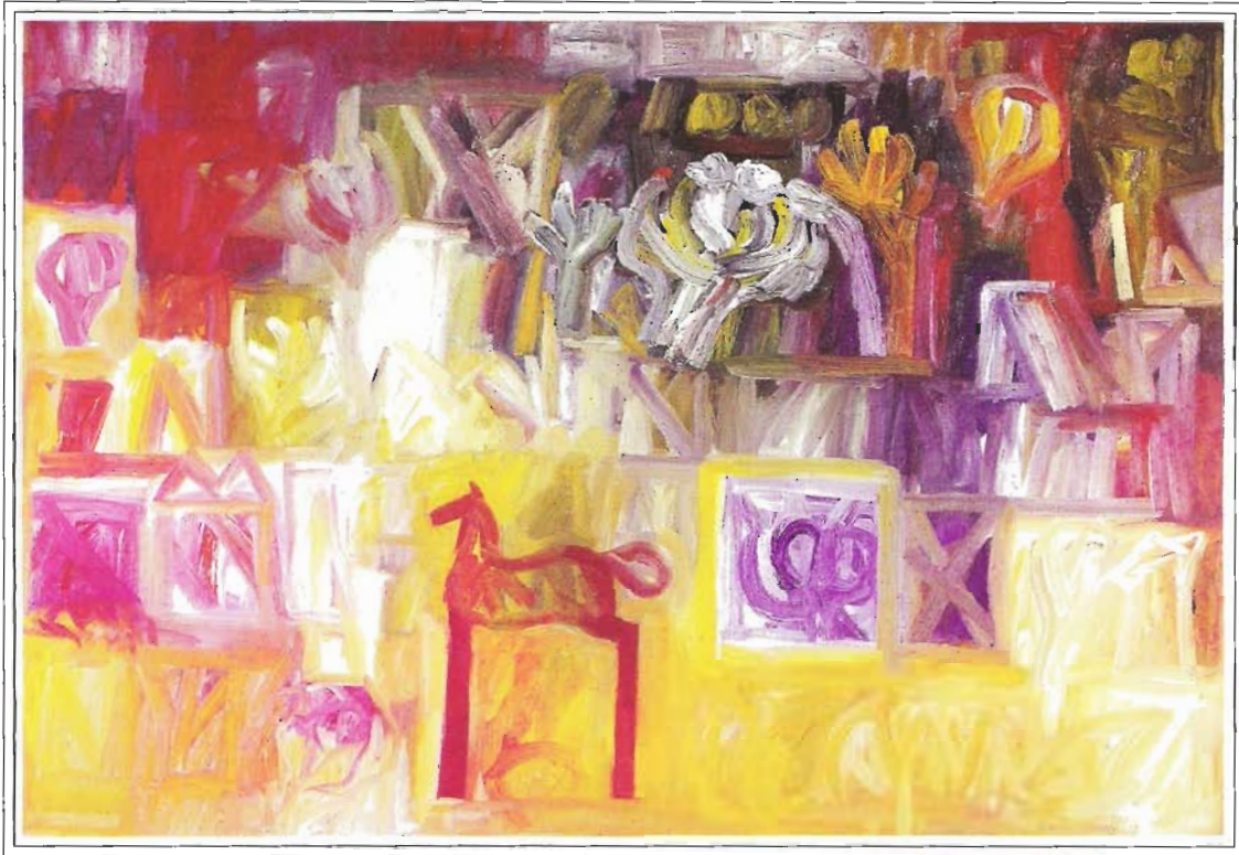
"La Vida es Bella", 130/190 cm, Óleo sobre tela, año 2000.