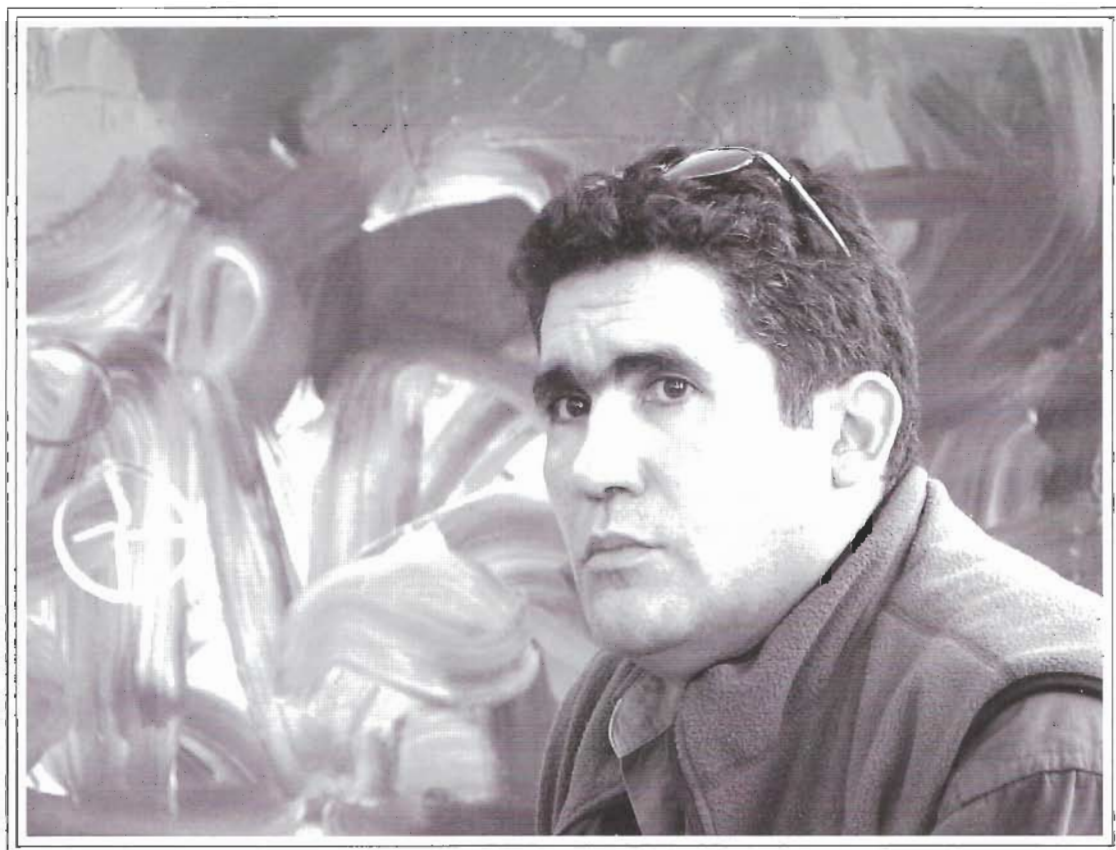
EL ARTISTA EN SU TALLER

Fundametal, Valencia, Estado Carabobo - Parque Bolivariano, Aroa, Estado Yaracuy Jardín Botánico, Caracas, Venezuela - Fundarte, Caracas, Venezuela - Museo al Aire Libre, Mérida, Estado Mérida - Parque Baconao, Santiago de Cuba, Cuba - Mavesa, Caracas, Venezuela - Sural, Ciudad Guayana, Estado Bolívar - Estación Chacao, Metro de Caracas, Caracas, Venezuela - Plaza Prebo, Valencia, Estado Carabobo - Espacio Artístico Club Bolívar, Coro, Estado Falcón - AVAP, Valencia, Estado Carabobo, Casa de la Cultura, La Asunción, Estado Nueva Esparta