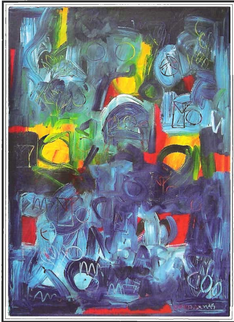
«MOVIENTO EN AZUL», 130x190 cm, Acrílico sobre Lienzo, Año 2003