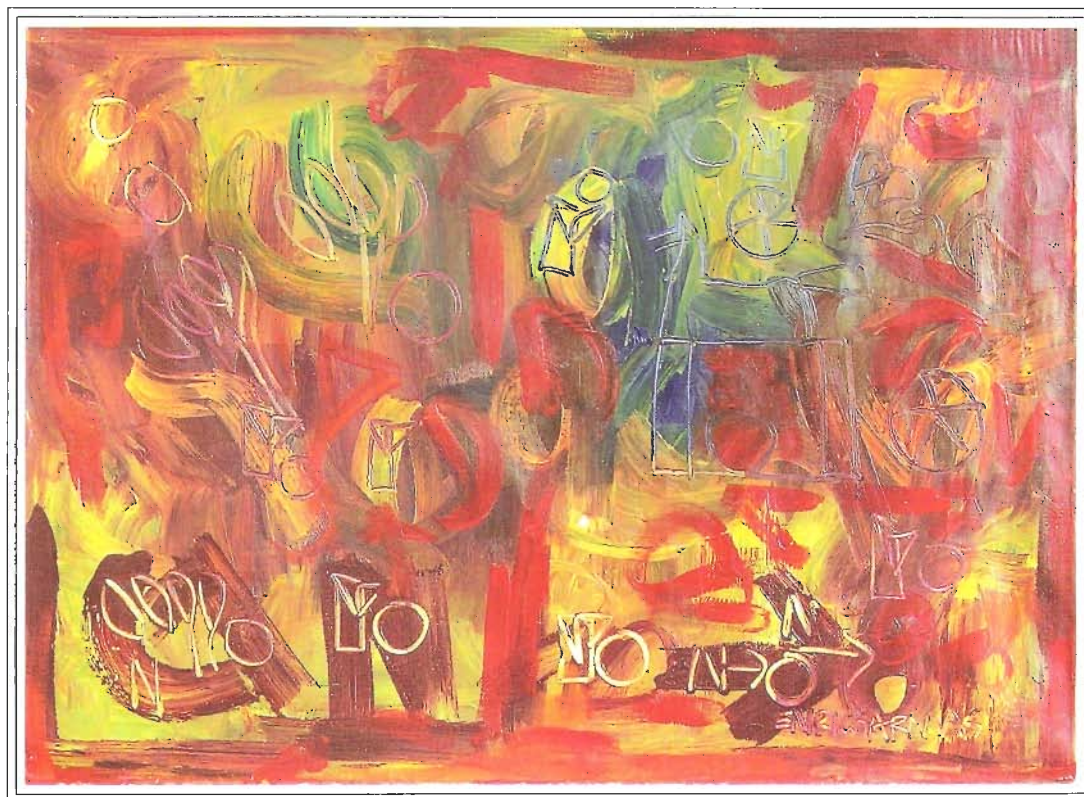
«MUNDO TROPICO I», 10x140 cm, Acrílico sobre Lienzo, Año 2003