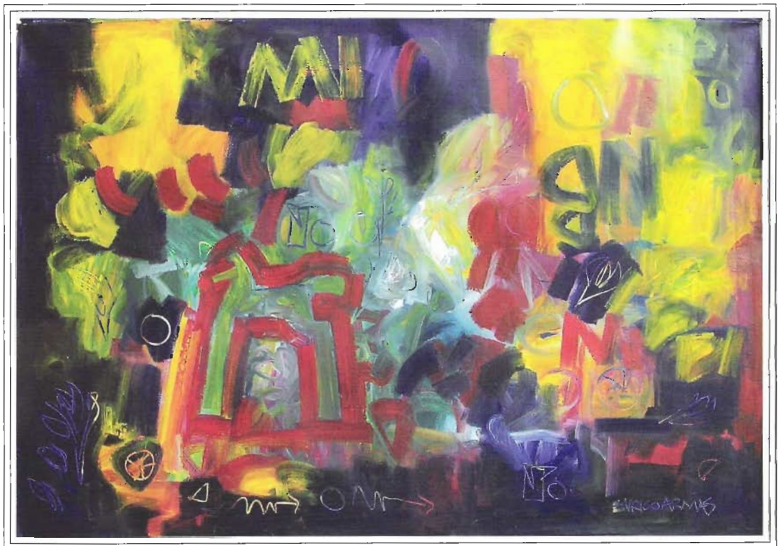
«ARCO TRICOLOR», 130x190 cm, Acrílico sobre Lienzo, Año 2003