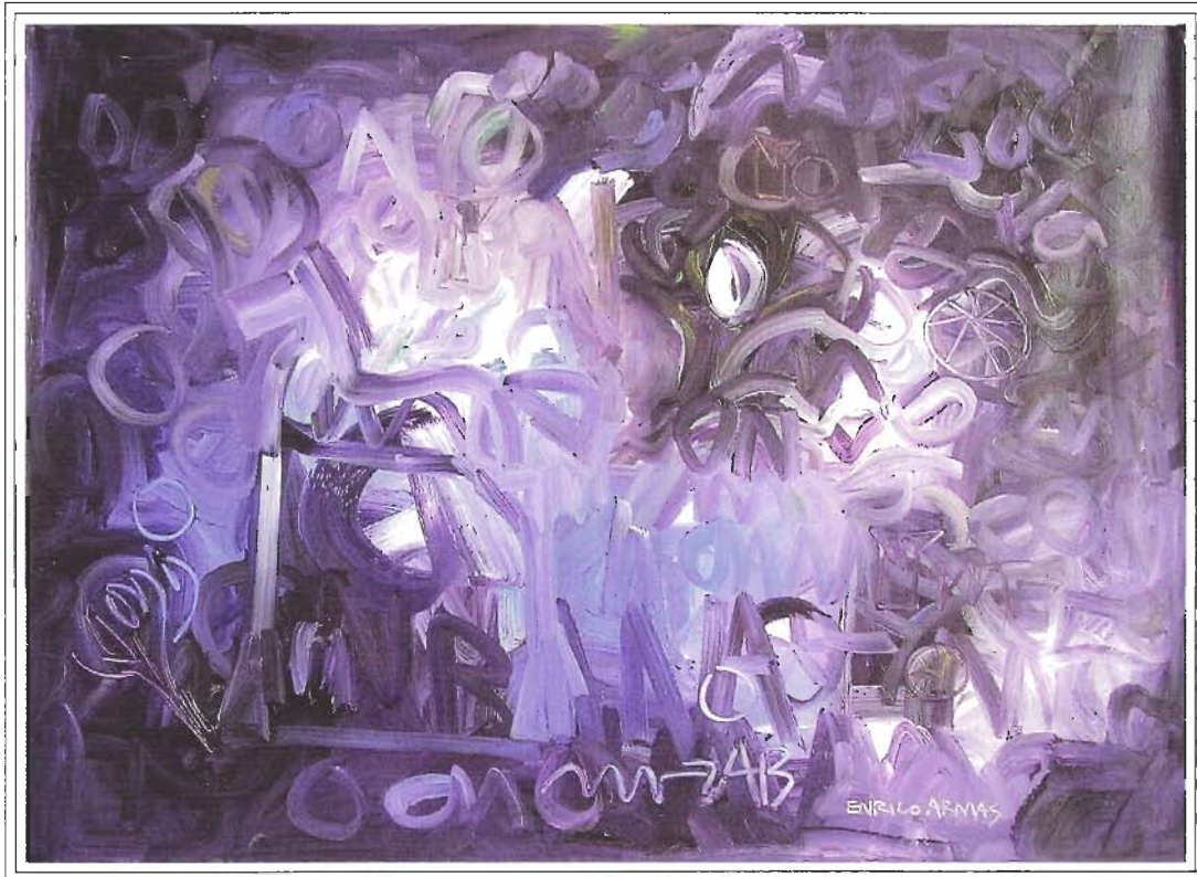
«NOCTURNO EN VIOLETA», 100x140 cm, Acrílico sobre Lienzo, Año 2003