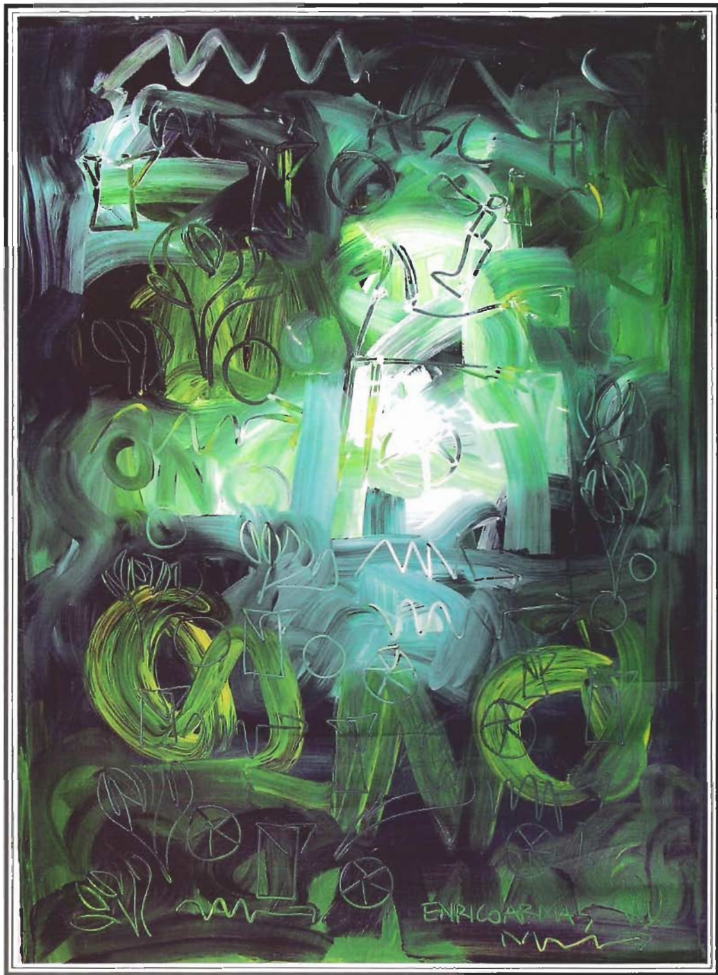
«VERDE AZUL SAGRADO», 140x100 cm, Acrílico sobre Lienzo, Año 2003