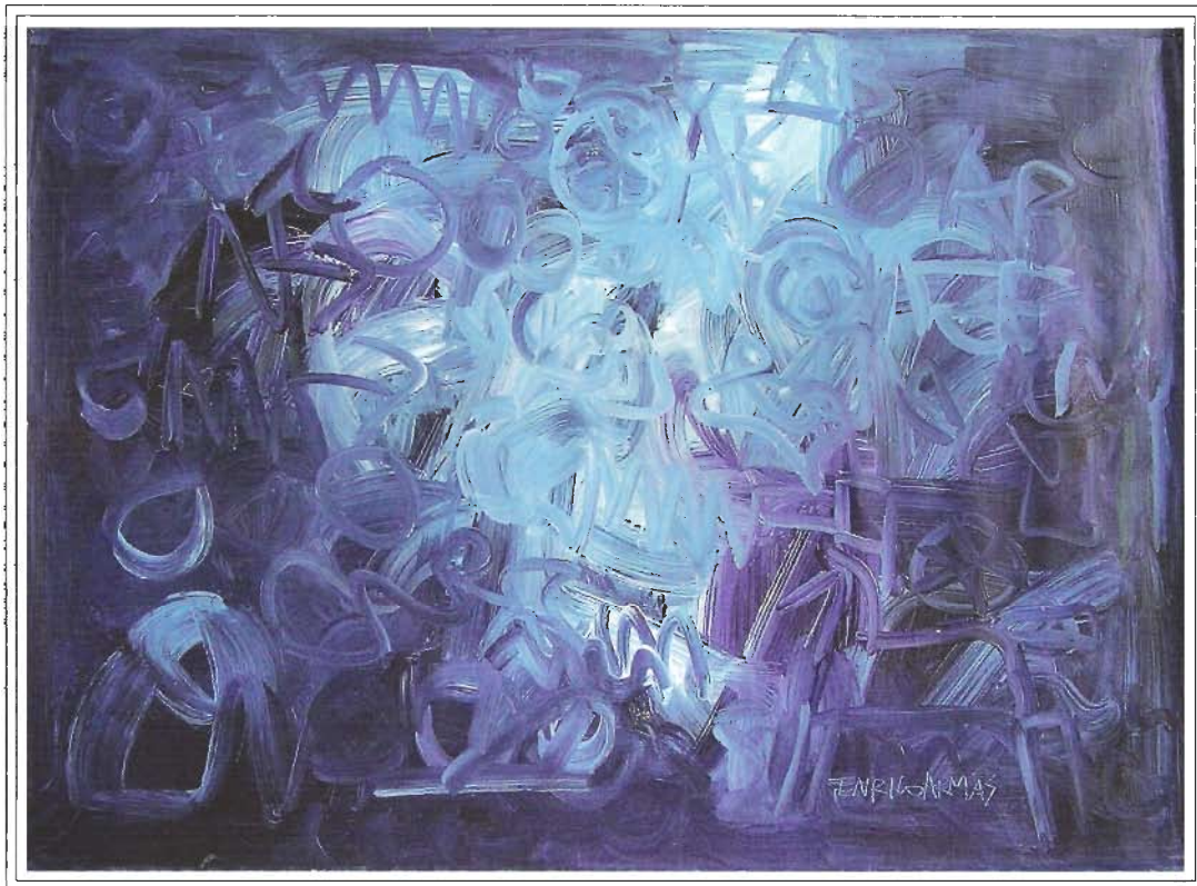
«MEMORIA EN AZUL», 100x140 cm, Acrílico sobre Lienzo, Año 2003