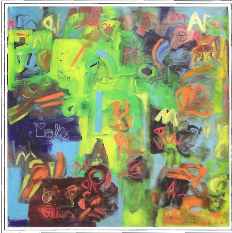
«MÁGIA TROPICO», 150x150 cm. Acrílico sobre Lienzo, Año 2003