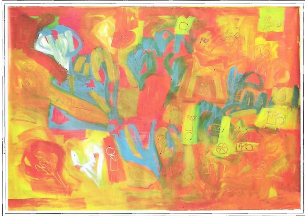
«MOVIENTO EN AZUL», 130x190 cm, Acrílico sobre Lienzo, Año 2003