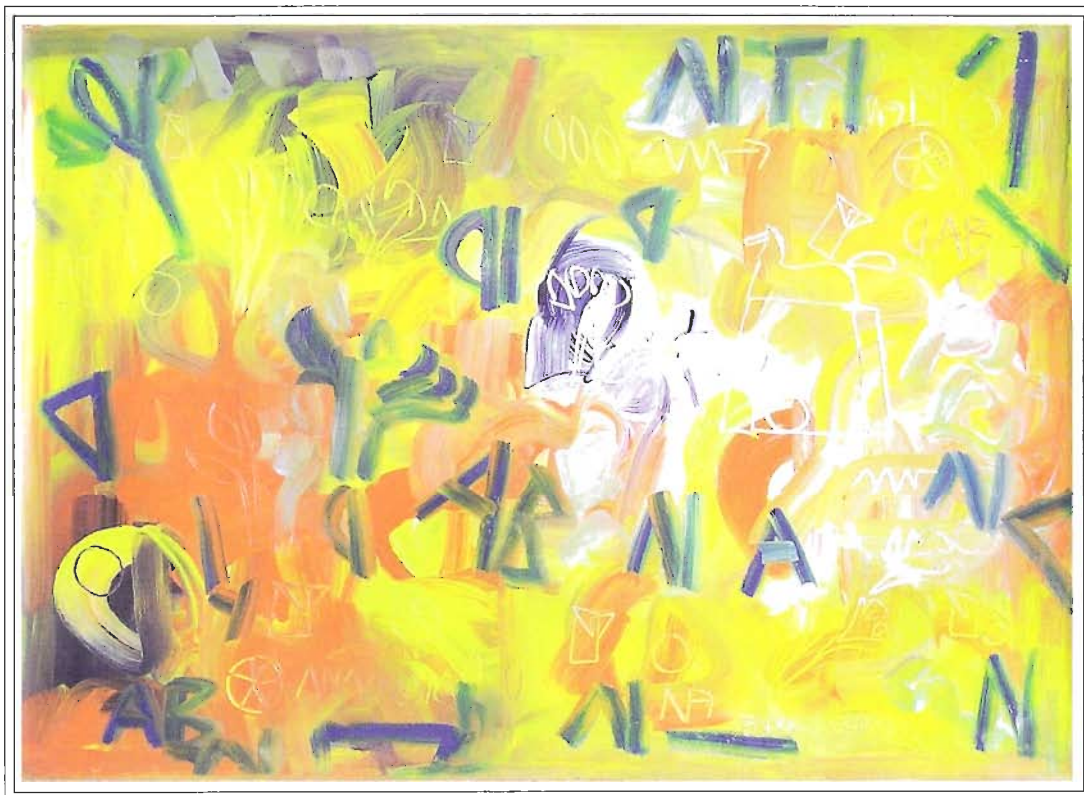
«ESPACIO Y LABERINTO», 100x140 cm, Acrílico sobre Lienzo, Año 2003